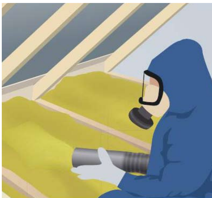
Ofta anlitas professionella lösullsentreprenörer för själva isoleringsarbetet.

Södra Sverige Norra Sverige 400 mm 500 mm 350 mm 450 mm 300 mm 400 mm