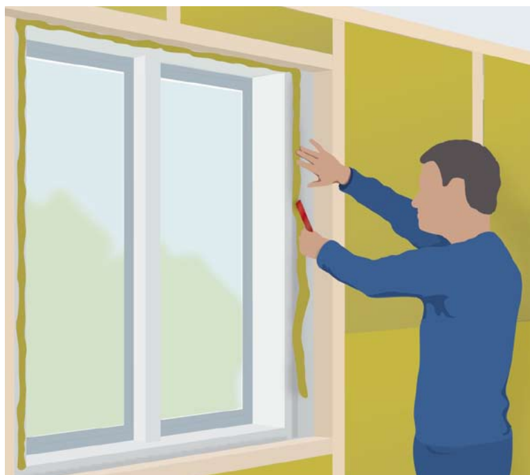
Drevning runt fönster minskar värmeförluster och drag.

Energieffektiva fönster isolerar så effektivt att nästan ingen rumsvärme når ut till det yttersta glaset. Utvändig kondens kan förekomma men är också ett bevis på att fönstret effektivt hindrar rumsvärmen från att transporteras ut.