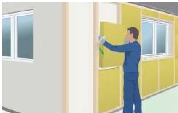
Utvändig tilläggsisolering med träregler.

I detta fall bör man ta kontakt med ett företag eller med en yrkeskunnig person eftersom arbetet kräver kunskap om material och lösningar. Passa på att tilläggsisolera sockeln samtidigt.